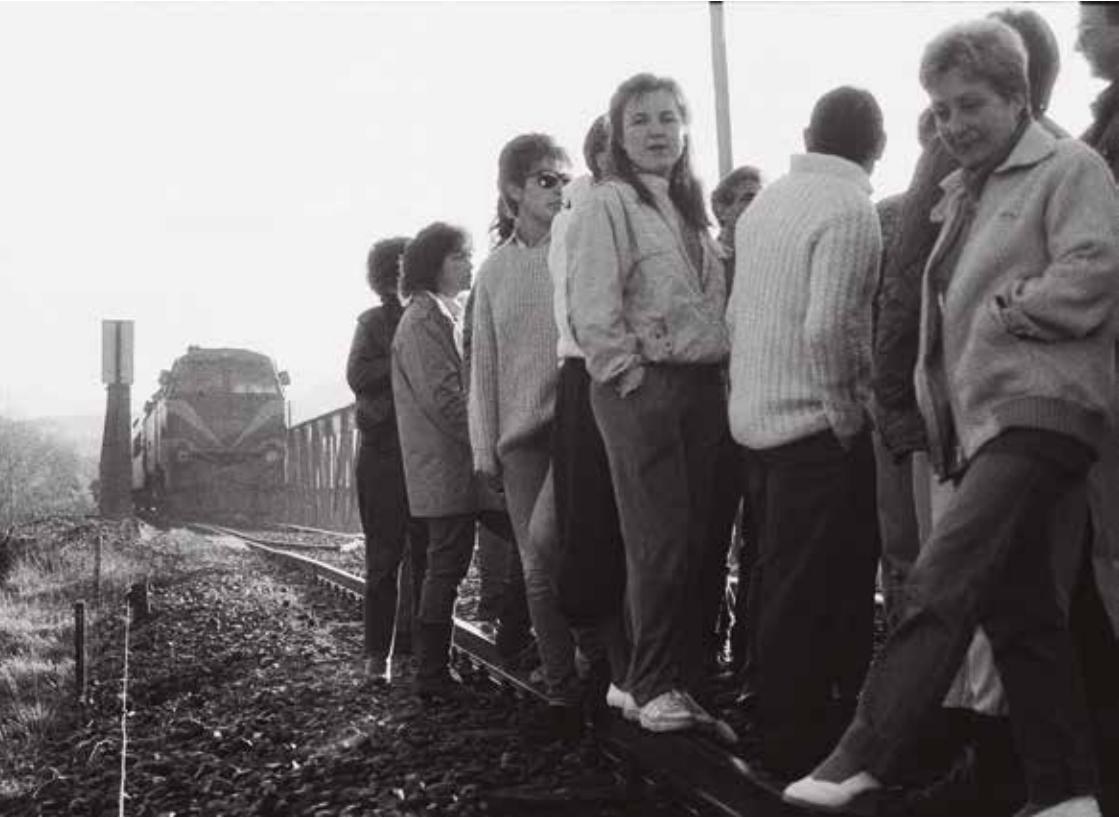
Caldearenas vecinas por el tren