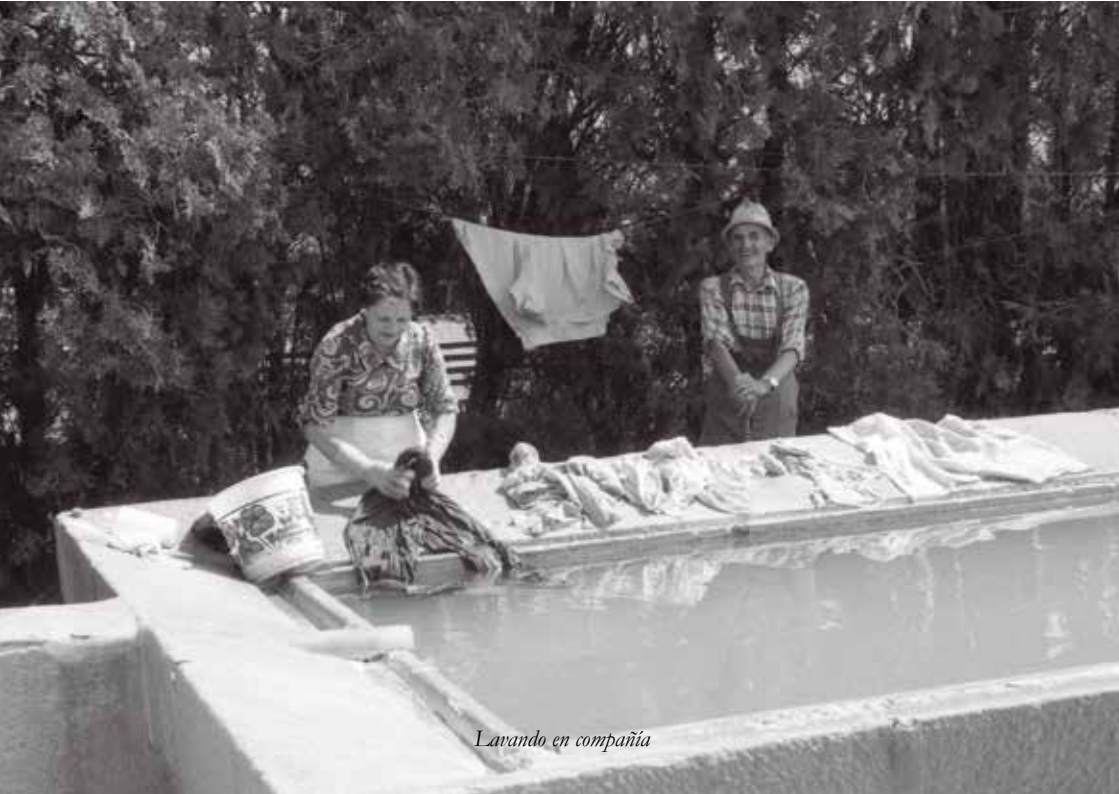
Lavando en compañía