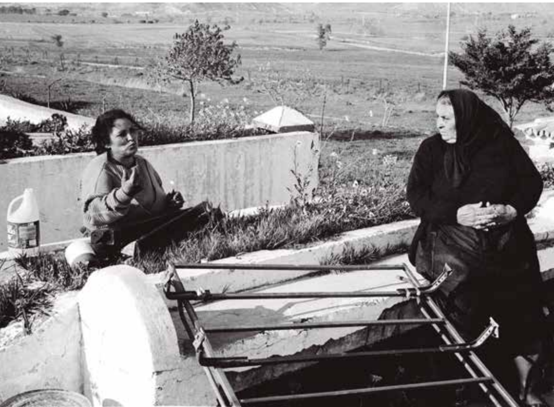
Desalojo cerro polvorín