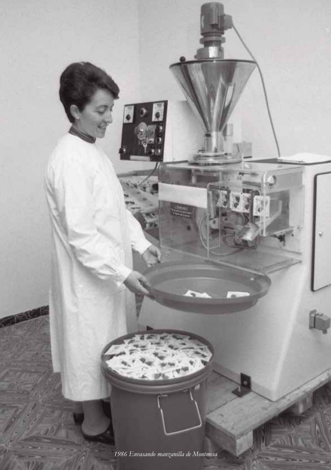
1986 Emvasando manzanilla de Montmesa