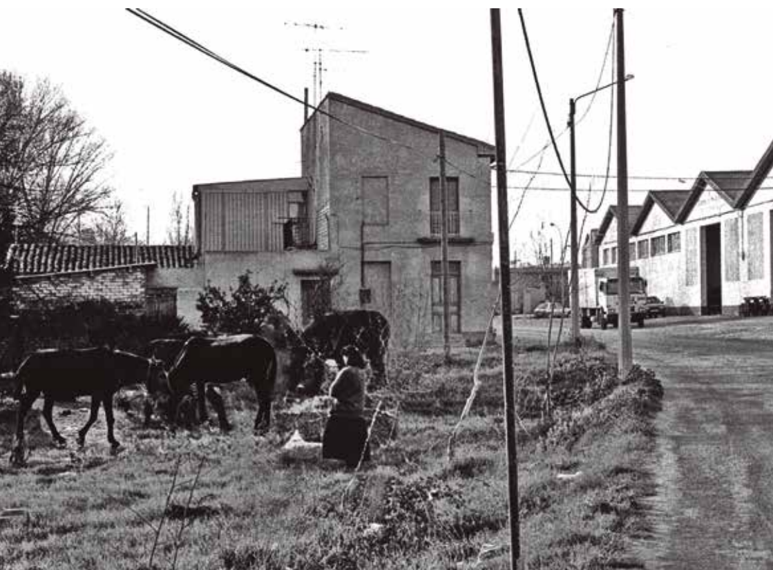
Caballos en la Alameda