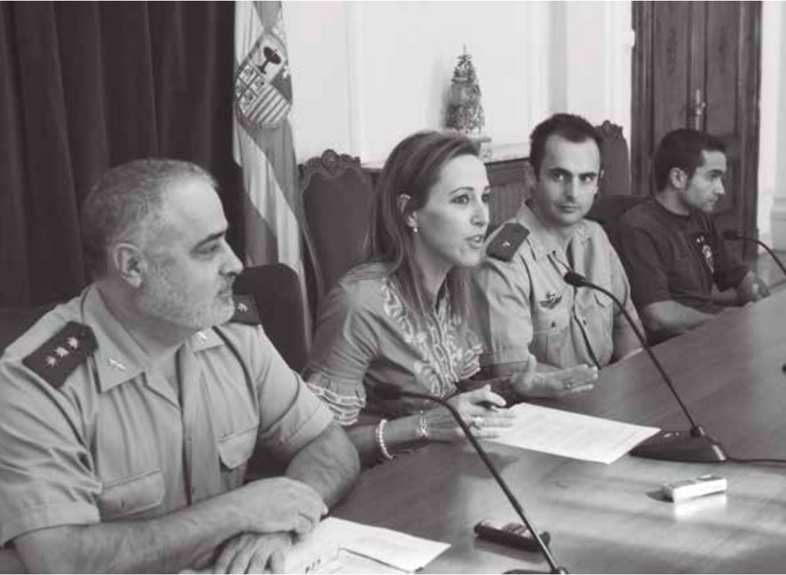
Maite Lacruz, Subdelegada de Gobierno