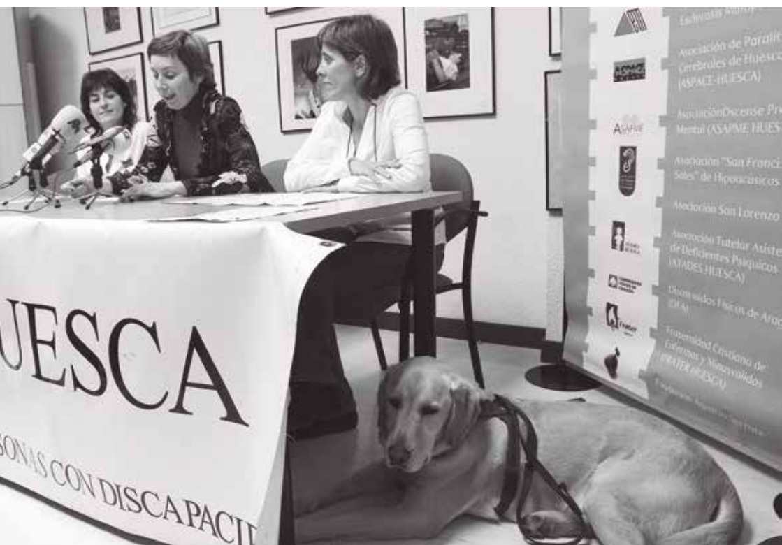
Mujeres con discapacidad