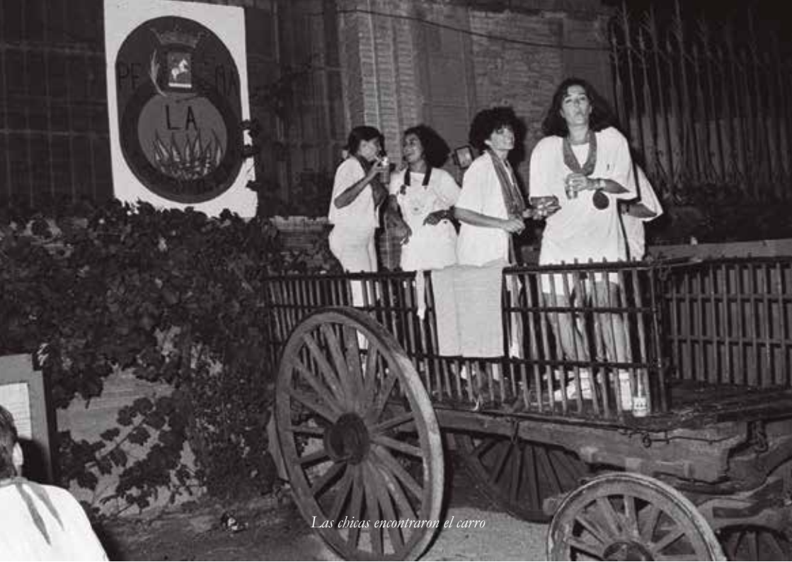
Las chicas encontraron el carro